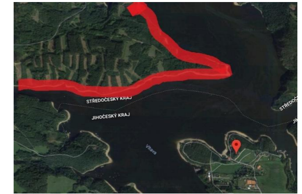
9) Rekreační středisko Jitex (cca 4. ř. km Otavy)