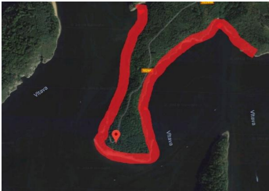
4) Na Pískách (162. – 161. ř. km Vltavy)