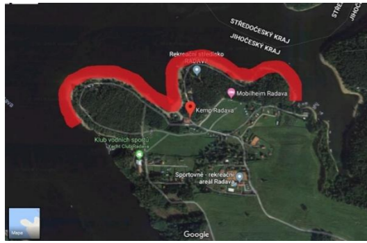
2) Velký vír (156. ř. km Vltavy)