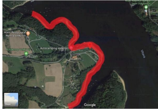
3) Chrást (156. ř. km Vltavy)