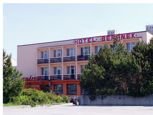
Mapka Hotelu Beránek: na třetí světelné křižovatce ze směru od Plzně odbočit vlevo a opět vlevo)